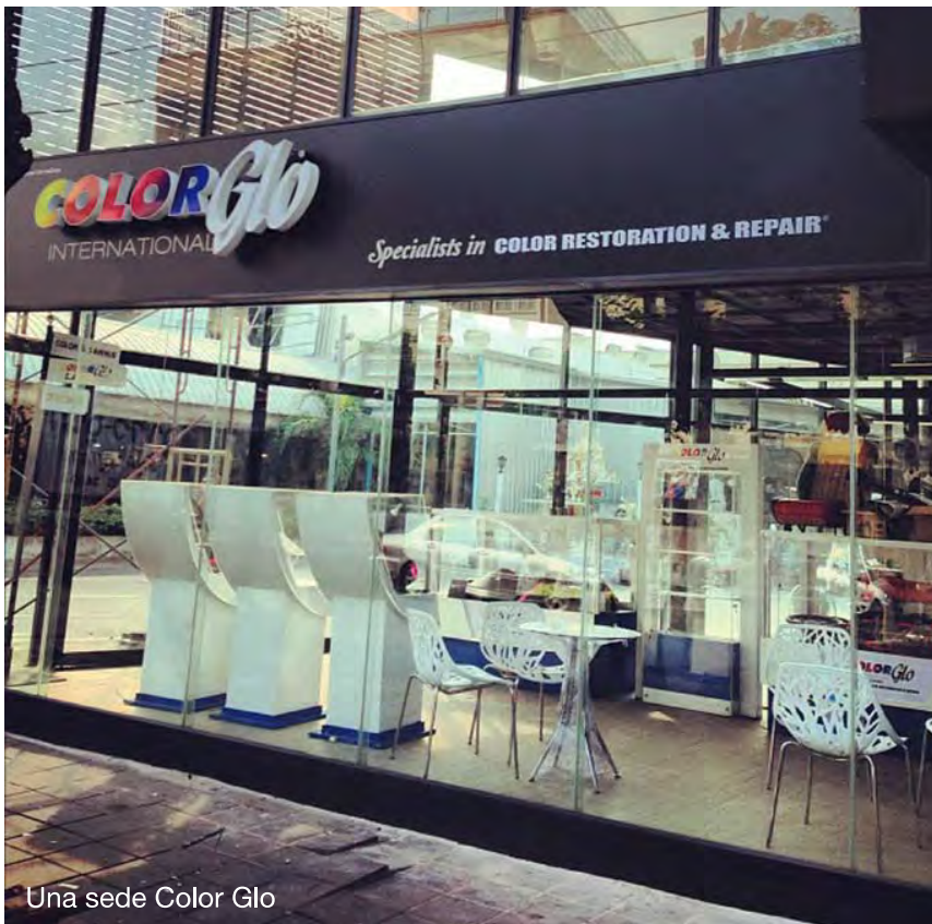
Una sede Color Glo

per un peso del comparto franchising pari al 90 per cento.